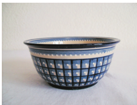
Bezeichnung: Schüssel Größe 5

Durchmesser: 10,5 cm Höhe: 5,5 cm Preis auf Anfrage