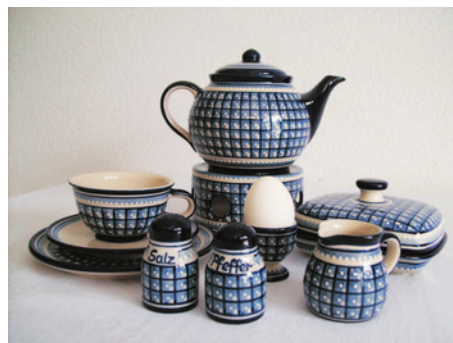
Bezeichnung: Gedeckter Frühstückstisch, 12- teilig

Durchmesser: - Höhe: - Preis auf Anfrage