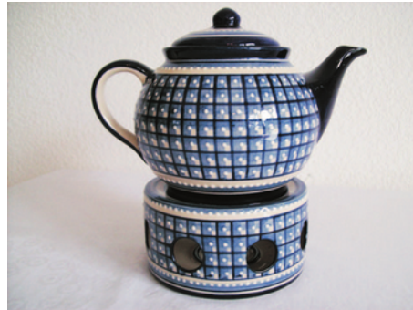
Bezeichnung: Teekanne mit Stövchen

Durchmesser: - Höhe: - Preis auf Anfrage