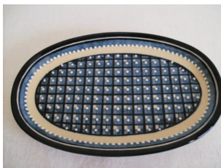
Bezeichnung: ovale Platte klein

Durchmesser: 21,5 cm x 14,5 cm Höhe: - Preis auf Anfrage