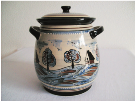
Bezeichnung: Kartoffeltopf 5l

Durchmesser: 20 cm Höhe: 21,5 cm Preis auf Anfrage