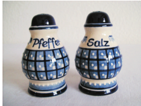
Bezeichnung: Streuer groß

Durchmesser: 5 cm Höhe: 8,5 cm Preis auf Anfrage