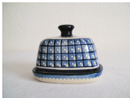
Bezeichnung: Butterdose klein

Durchmesser: 11 cm x 8 cm Höhe: 8,5 cm Preis auf Anfrage