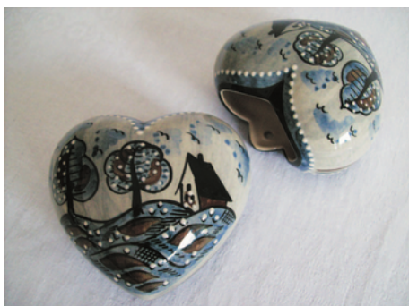
Bezeichnung: Wandvase Herzform

Durchmesser: 12 cm Höhe: 8,5 cm Preis auf Anfrage