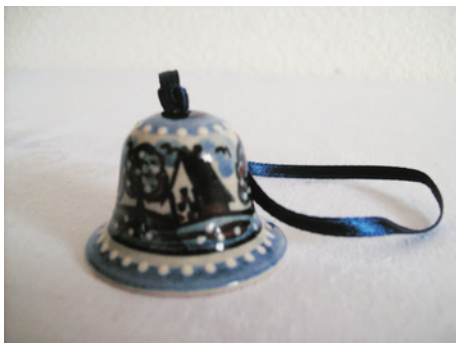
Bezeichnung: Glocke klein

Durchmesser: 5 cm Höhe: 5,5 cm Preis auf Anfrage