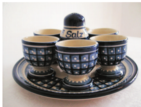
Bezeichnung: Eierbecherset, 8-teilig

Durchmesser: - Höhe: - Preis auf Anfrage