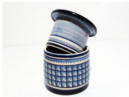
Bezeichnung: französische Wasserbutterdose

Durchmesser: - Höhe: - Preis auf Anfrage