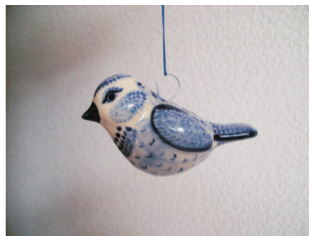
Bezeichnung: Vogel fliegend oder sitzend Durchmesser: - Höhe: - Preis auf Anfrage

Bankverbindung: Kreissparkasse Bautzen; IBAN DE88 8555 0000 1102 2114 82; BIC: SOLADES1BAT ; Steuer-Nr.:204/269/04064