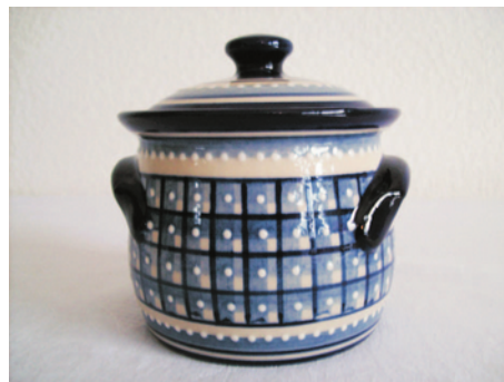
Bezeichnung: Schmalztopf/ Vorratsdose

Durchmesser: 11,5 cm Höhe: 10 cm Preis auf Anfrage