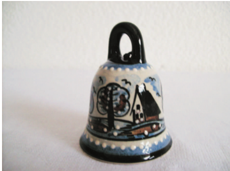
Bezeichnung: Glocke mit Henkel mittel

Durchmesser: 5,5 cm Höhe: 7,5 cm Preis auf Anfrage