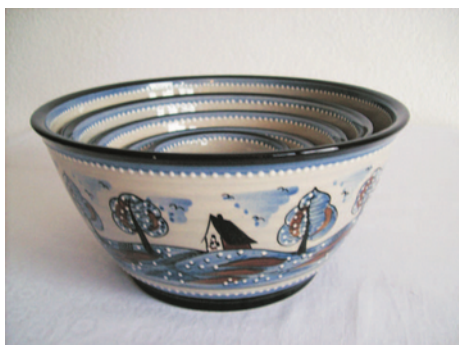
Bezeichnung: Schüsselsatz, 5-teilig

Durchmesser: 10,5 cm Höhe: 5,5 cm Preis auf Anfrage