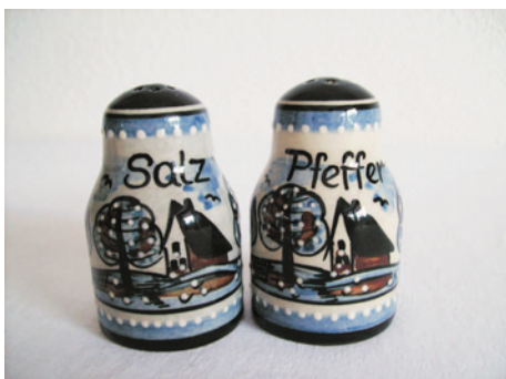
Bezeichnung: Streuer klein

Durchmesser: 4,5 cm Höhe: 7 cm Preis auf Anfrage