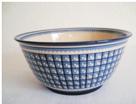
Bezeichnung: Schüssel Größe 3 und 4

Durchmesser: 18 cm Höhe: 8 cm Preis auf Anfrage