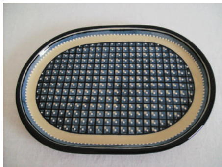
Bezeichnung: ovale Platte groß

Durchmesser: 28,5 cm x 20,5 cm Höhe: 2,5 cm Preis auf Anfrage