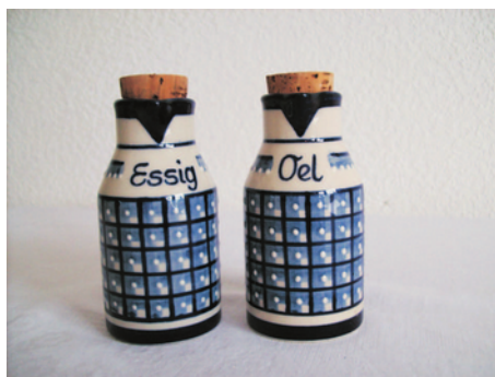
Bezeichnung: Essig- und Ölkännchen

Durchmesser: 5,5 cm Höhe: 10,5 cm Preis auf Anfrage