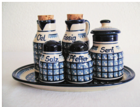
Bezeichnung: Menage, 6-teilig Durchmesser: - Höhe: - Preis auf Anfrage