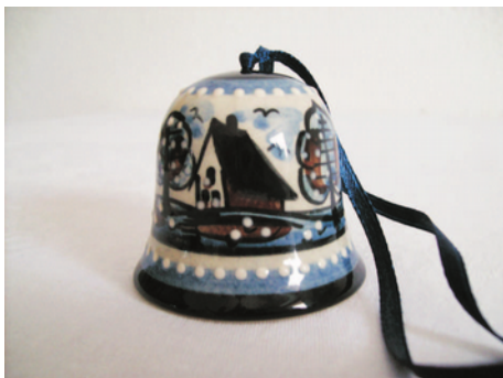
Bezeichnung: Glocke mittel

Durchmesser: 5,5 cm Höhe: 7,5 cm Preis auf Anfrage