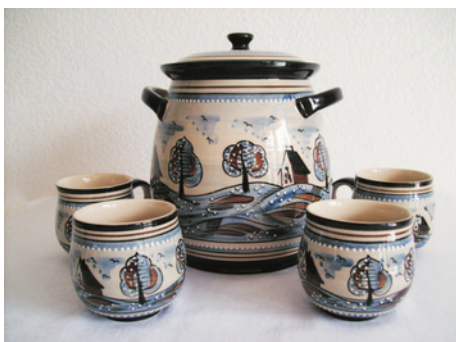
Bezeichnung: Bowletopf mit 4 Bowletassen

Durchmesser: 20 cm Höhe: 21,5 cm Preis auf Anfrage