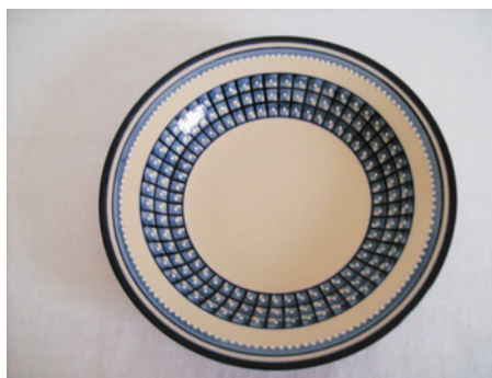
Bezeichnung: Speiseteller tief

Durchmesser: 24 cm Höhe: 4 cm Preis auf Anfrage