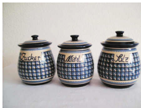
Bezeichnung: Vorratsdose/Mehl, Zucker, Salz

Durchmesser: 20 cm Höhe: 21,5 cm Preis auf Anfrage